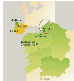
Galicia y el área del Plan Ferrol

Por otro lado, el Ministerio de Industria Español y el Instituto Gallego de Promoción Económica canalizan, a través de programas específicos como el Plan Ferrol, atractivos incentivos que